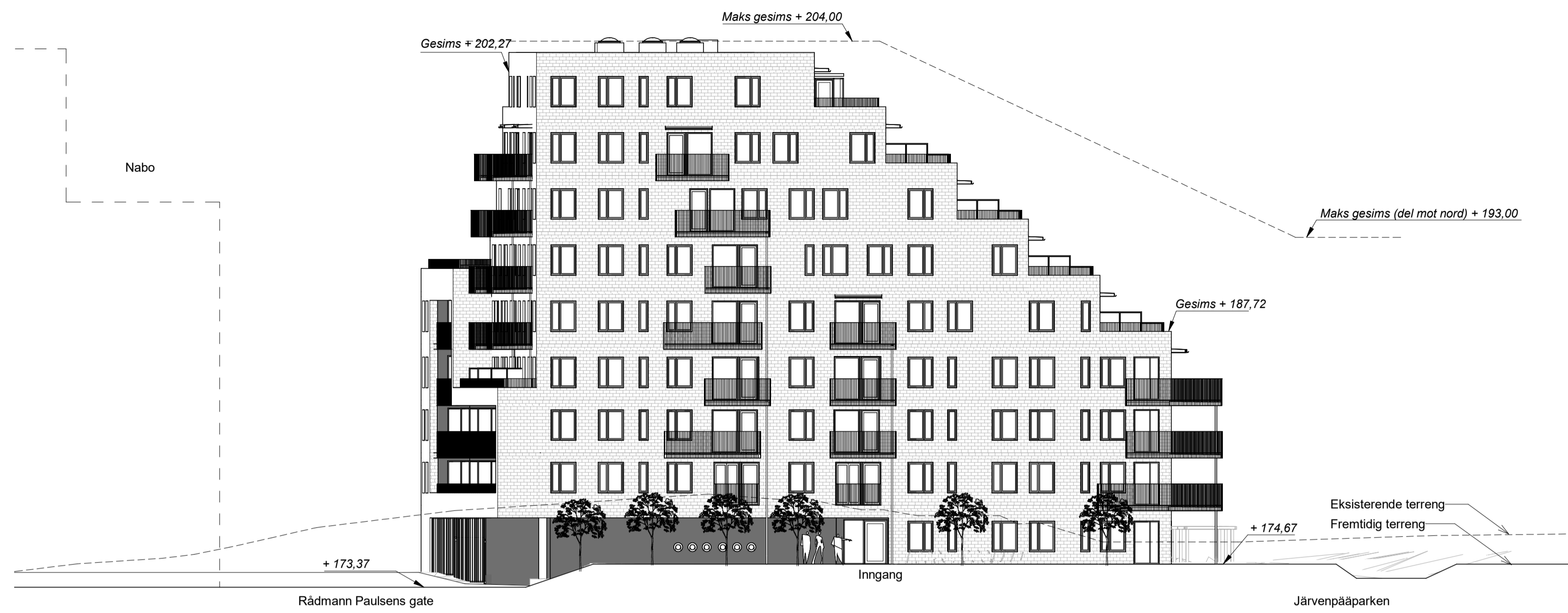
Kundetegning-Fasade Nord 1 : 200