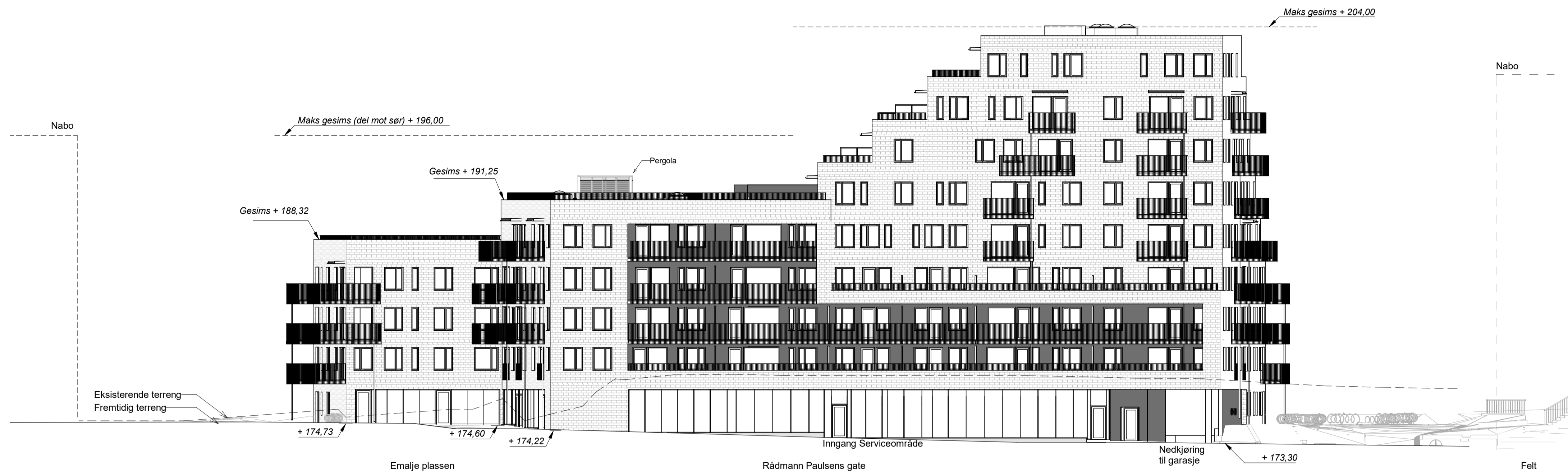
Kundetegning-Fasade Øst 1 : 200