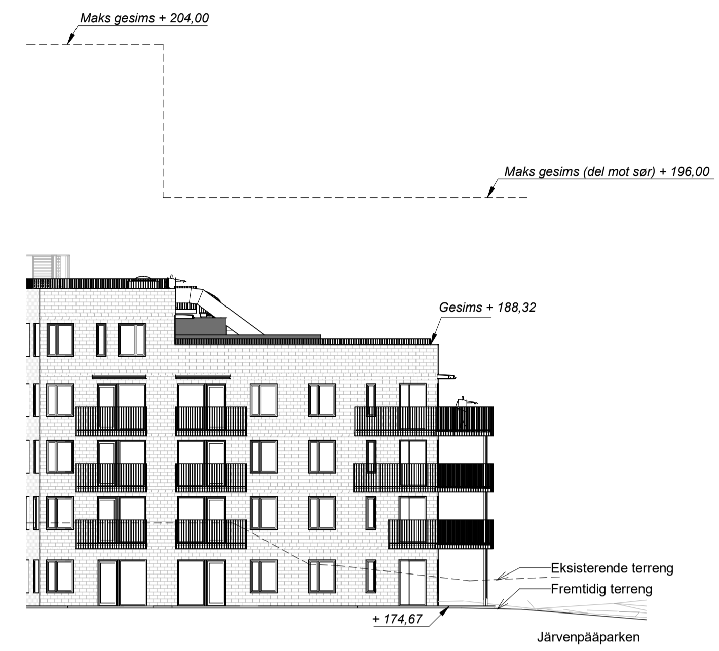
Kundetegning-Fasade Nord i gårdsrom 1 : 200