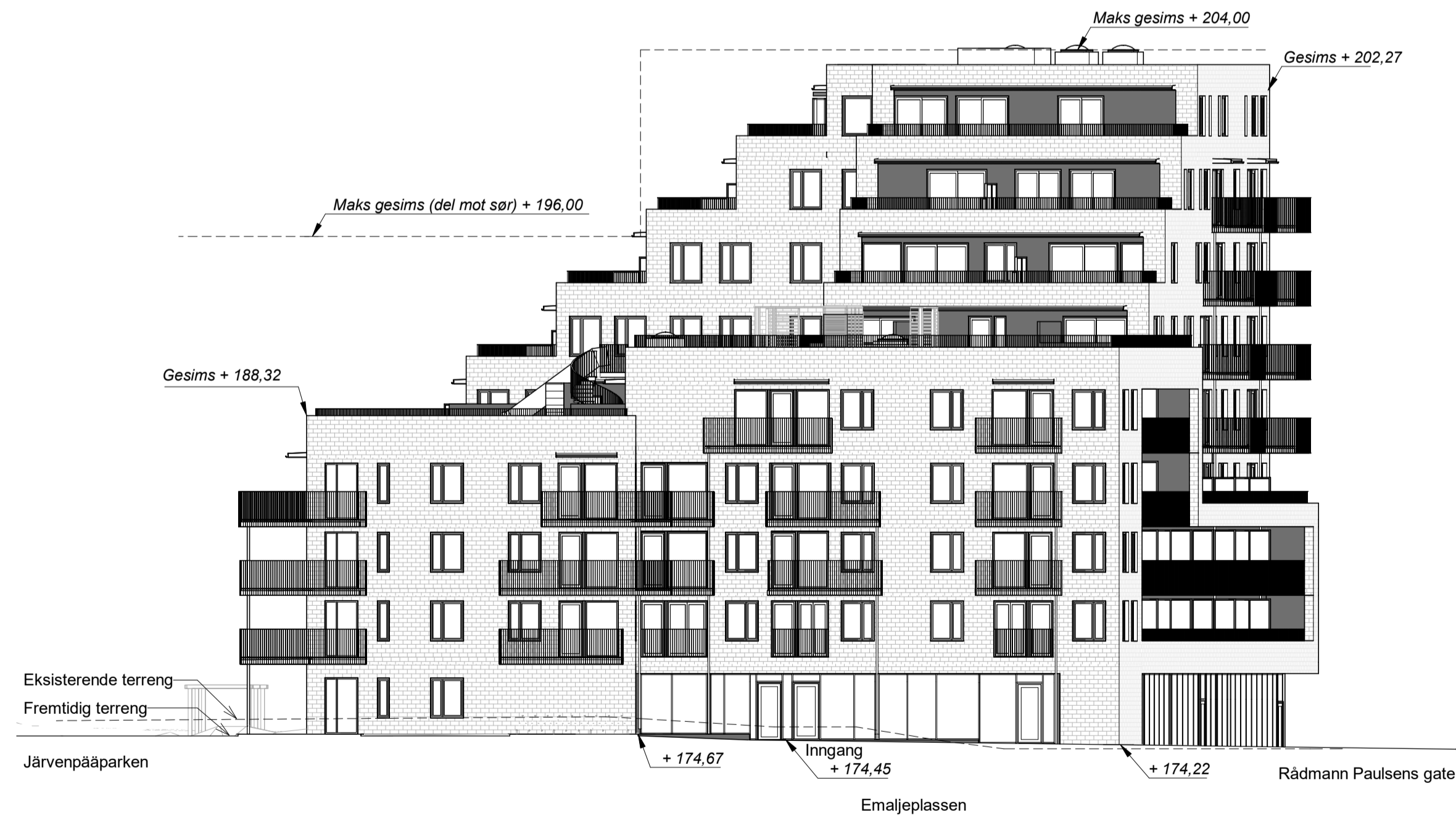
Kundetegning-Fasade Sør 1 : 200