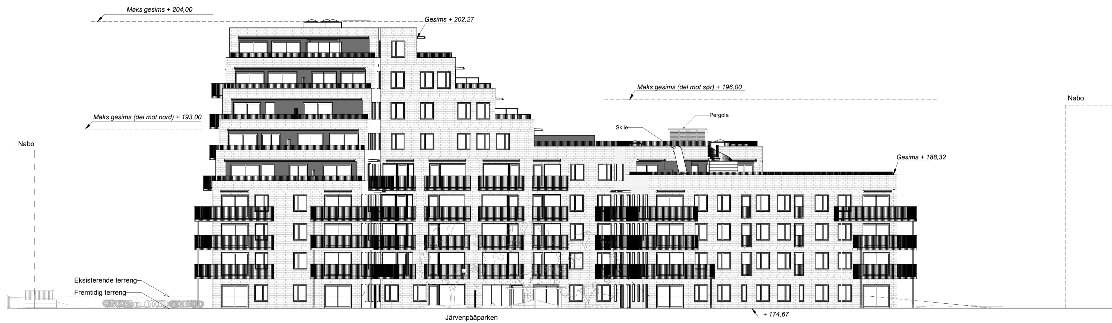
Kundetegning-Fasade Vest 1 : 200